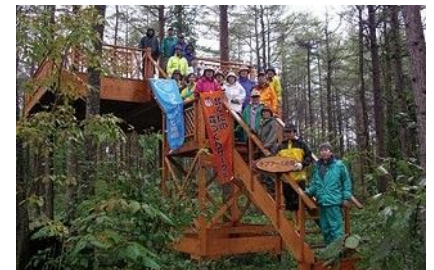
トラストの森のツリーハウス